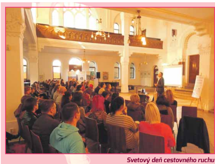
Svetový deň cestovného ruchu

Nitrianska organizácia cestovného ruchu a Mesto Nitra aj v roku 2015 pripravili obľúbenú ŠARKANIÁDU . Podujatie sa konalo v sobotu 10. októbra na Kalvárii v Nitre so začiatkom o 13.00 hodine.