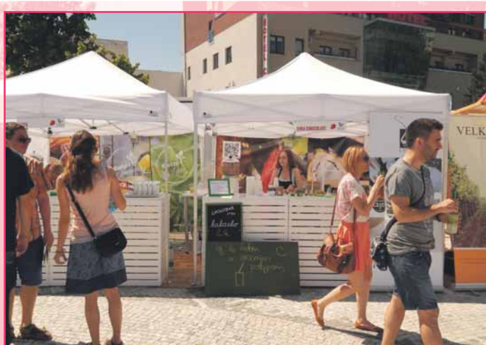
Festival chutí Nitrianskeho kraja

Nitrianska organizácia cestovného ruchu v roku 2015 po prvýkrát zastrešila aj medzinárodné podujatie Noc múzeí a galérií . Počas tohto jedinečného večera, ktorý sa konal 16. mája, sa v múzeách a galériách v Nitre konal netradičný program a zároveň súťaže o atraktívne ceny. V Slovenskom poľnohospodárskom múzeu si najmenší návštevníci skúsili jazdu na detskom elektrickom vláčiku, navštívili hospodársky dvor so zvieratkami a opekali si dobroty na ohnisku. V Nitrianskej galérii boli okrem aktuálnych výstav pripravené aj zaujímavé kvízy a výtvarná tvorivá dielňa. V Synagóge bola okrem stálej expozície „Osudy slovenských Židov“ pripravená prednáška „Svedectvo tých, ktorí prežili – vplyv holokaustu na životy obyčajných ľudí“. Diecézne múzeum ponúklo svojim návštevníkom okrem sprevádzania aj koncert kapely Páni času alebo premietanie filmu v Gotickej priekope. Ponitrianske múzeum si pre svojich návštevníkov prichystalo ukážky zo svojej činnosti a interaktívny program „Spoznávaj naše zvieratá“ spojený s prehliadkou výstavy „Život v lesných a vodných biotopoch“. Súčasťou programu bolo aj vystúpenie združenia MUSICANTICA SLOVACA. V aule Misijného domu na Kalvárii sa v pravidelných intervaloch premietal film o Misijnom múzeu.