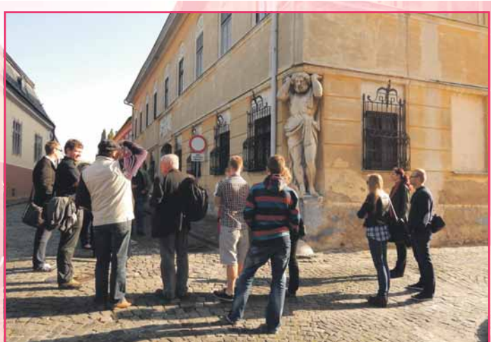
Po stopách nitrianskych legiend

K najobľúbenejším a najvyužívanejším zážitkovým balíčkom už dlhodobo patrí produkt Po stopách nitrianskych legiend , počas ktorého sa návštevníci vydajú na putovanie po stopách zaujímavých legiend a objavujú krásy Horného a Dolného mesta Nitry. Zažívajú legendy o kobyľkách, zemetraseniach a požiaroch, legendy O troch prútoch kráľa Svätopluka, Pribinovi, Corgoňovi alebo legendu o sv. Emerámovi. Na nádvorí hradu si vypočujú legendu o Vazulovi alebo legendy o strašidlách pod Zoborom.