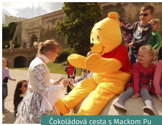
Čokoládová cesta s Mackom Pu

V rámci podpory produktov cestovného ruchu sme zabezpečovali dopravu formou turistického vláčika. Realizáciu projektu spustenia Teatrobusu sme nezrealizovali vzhľadom k tomu, že člen organizácie dopravná spoločnosť ARRIVA NITRA nemala prostriedky na zakúpenie autobusu, ktorý by spĺňal podmienky na realizáciu tejto aktivity. Taktiež sa nepodarilo spojzdať historickú železničku v areáli Agrokomplexu kvôli zlému technickému stavu vozidla. Na odstránení technických nedostatkov sa ešte stále pracuje.