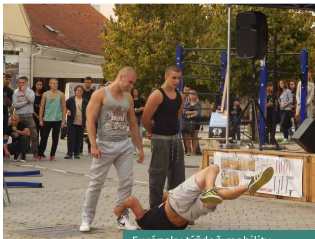
Európsky týždeň mobility

Mesto Nitra, Nitrianska organizácia cestovného ruchu a dopravná spoločnosť Arriva sa v roku 2014 zapojili do medzinárodného podujatia Európsky týždeň mobility . Od stredy 17. 9. do piatku 19. 9. bol na Svätoplukovom námestí po prvý krát sprístupnený „Potulný antikvariát“. Starý IKARUS sa tak zmenil na príjemné miesto vhodné na čítanie a posedenie pri kávičke. Atmosféru popoludnia dotvorila príjemná živá hudba. V piatok popoludní pešiu zónu zaplavili športové kluby, ktoré prezentovali svoje umenie. Predviedli sa napríklad šachový klub, Akadémia tanca, crossfit, bojové umenia, pole dance – tanec pri tyči a mnoho iných.