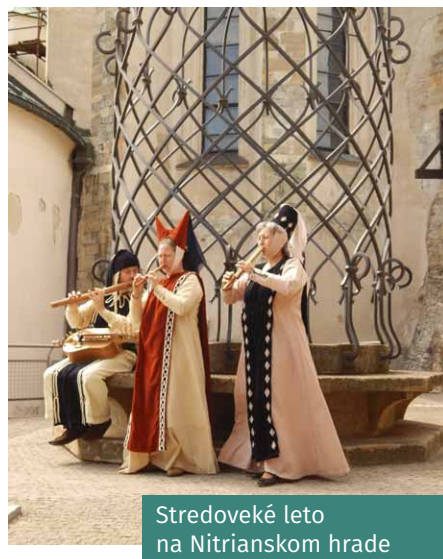
Stredoveké leto na Nitrianskom hrade

Ozvláštnením Nitrianskeho hradu počas letnej sezóny v roku 2014 bol zážitkový balíček Stredoveké leto na Nitrianskom hrade . V Diecéznom múzeu predstavil návštevníkom stredoveký mních spôsoby výučby v minulosti a písanie na voskové tabuľky. Vo Vazulovej veži boli prezentované stredoveké zbrane a dobové prvky odievania.