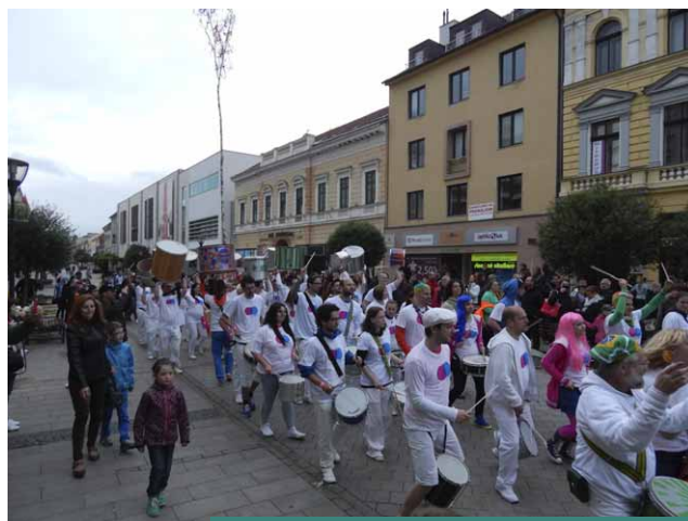
Otvorenie turistickej sezóny 2014

V rámci osláv Svetového dňa cestovného ruchu, ktoré sa konali aj v Nitre, mohli záujemcovia absolvovať viaceré aktivity súvisiace s cestovaním. Spolu so sprievodcom navštívili kostoly v centre mesta. Sprístupnené im boli krypty pri Kostole Navštívenia Panny Márie, Kostol reformovanej kresťanskej cirkvi ako aj Evanjelický kostol Svätého Ducha. Od 16.00 hodiny sa vo Fóre mladých konali cestovateľské prednášky. Počas prvej prednášky pod názvom LADA svetom traja cestovatelia prezradili aké to je cestovať 13 tisíc kilometrov v 40 ročnom aute po Iráne a Strednej Ázii. V rámci rozprávania o Afrike sa zúčastnení preniesli do krajín ako je Keňa, Burundi,