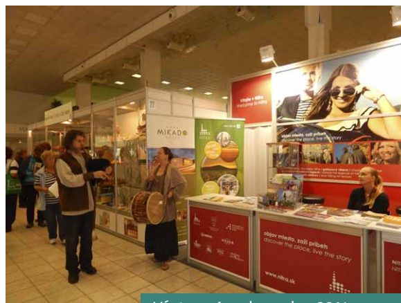
Výstava Agrokomplex 2014

Aj v roku 2014 sa Nitrianska organizácia cestovného ruchu zúčastnila viacerých výstav a veľtrhov cestovného ruchu. Na prelome januára a februára to bol cestovateľský veľtrh ITF SlovakiaTour v Bratislave 2014 a následne vo februári výstava Holiday World v Prahe. Na oboch veľtrhoch sme sa zúčastnili v rámci prezentačného stánku Nitrianskeho samosprávneho kraja. Mesto Nitra sa prezentovalo aj na veľtrhu Utazás v Budapešti v rámci expozície Slovenskej agentúry pre cestovný ruch. Informácie o Nitre a produktové balíčky Nitrianskej organizácie cestovného ruchu sme prezentovali aj návštevníkom výstav v Nitre a to na výstave Nábytok a bývanie v marci a na Gardenii v apríli. Už tradične sme boli medzi vystavovateľmi v rámci expozície Regióny Slovenska na poľnohospodárskej a potravinárskej výstave Agrokomplex.